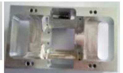
USINAGE TOURNAGE ET FRAISAGE CAPACITE MOYENNE Ø300mm