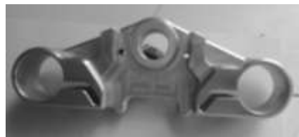
PIECES MACHINE SPECIALE